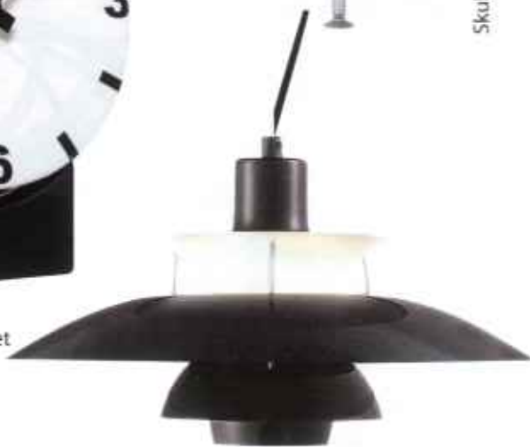
Klassisk PENDEL , PH50, i ny sort ver- sion, 3.995 kr. Fra Louis Poulsen.