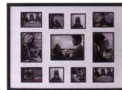
Sort GALLERIRAMME med plads til 11 fotos, 599 kr. Fra Present Time.