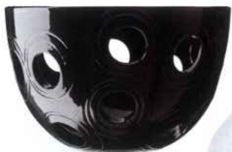
FRUGTSKÅLEN Spazio, designet af Bjørn Poulsen, 499 kr. Fra Kähler Keramik.