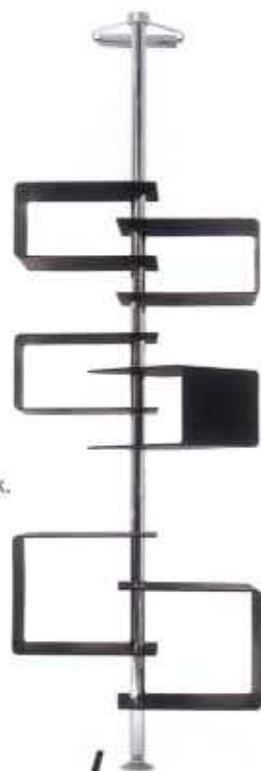
Skulpturel REOL , Support, designet af Claus Langhoff, Fra Hoff.