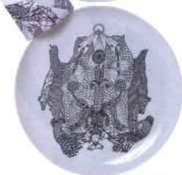
TALLERKENER eller platter med motiv, sæt med to, 599 kr. Fra Domestic v. Base 212.