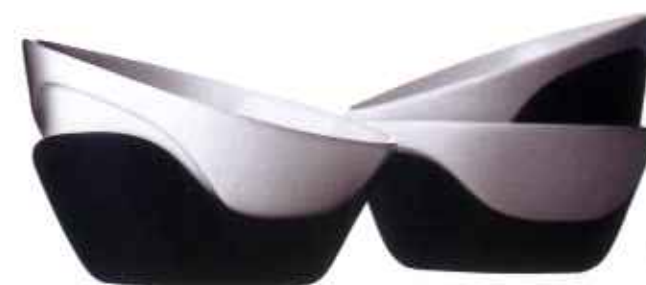
MULTISKÅL med silikonebund, design Jacob Wagner, 249 kr. Fra Menu.