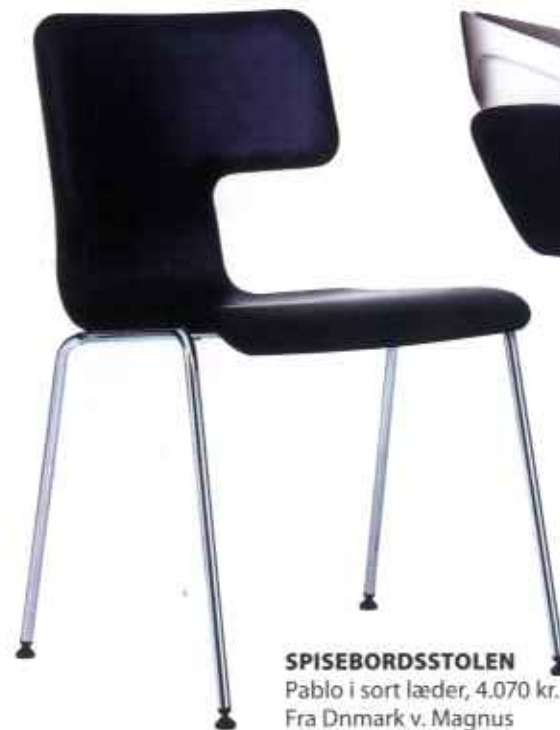
SPISEBORDSSTOLEN Pablo i sort læder, 4.070 kr. Fra Dnmark v. Magnus Olesen A/S.