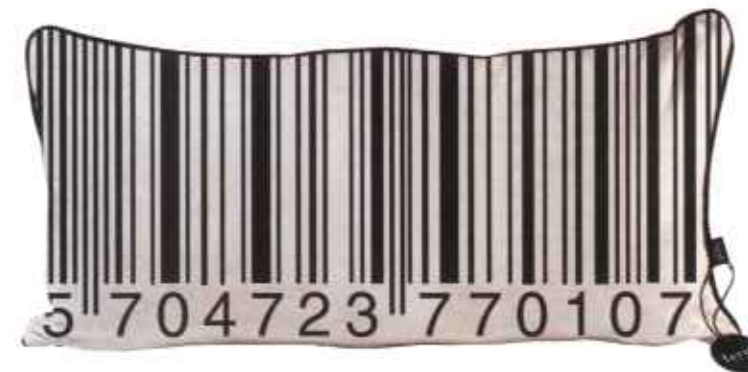
Aflang PUDE med print, 499 kr. inkl. dunfyld. Fra Ferm Living.