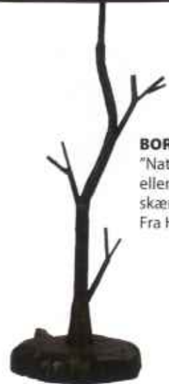
BORDLAMPE "Natur", med hvid eller mørkebrun skærm, 1.450 kr. Fra Hill Street.