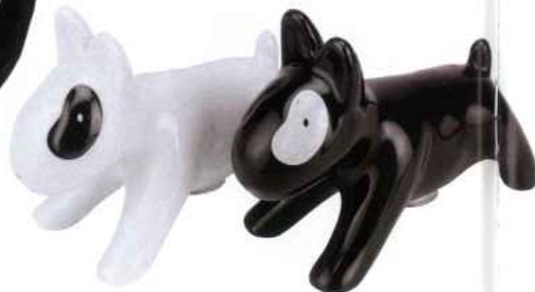
SALT- OG PEBERHUDE i porcelæn, 54 kr. pr. sæt. Fra Present Time.