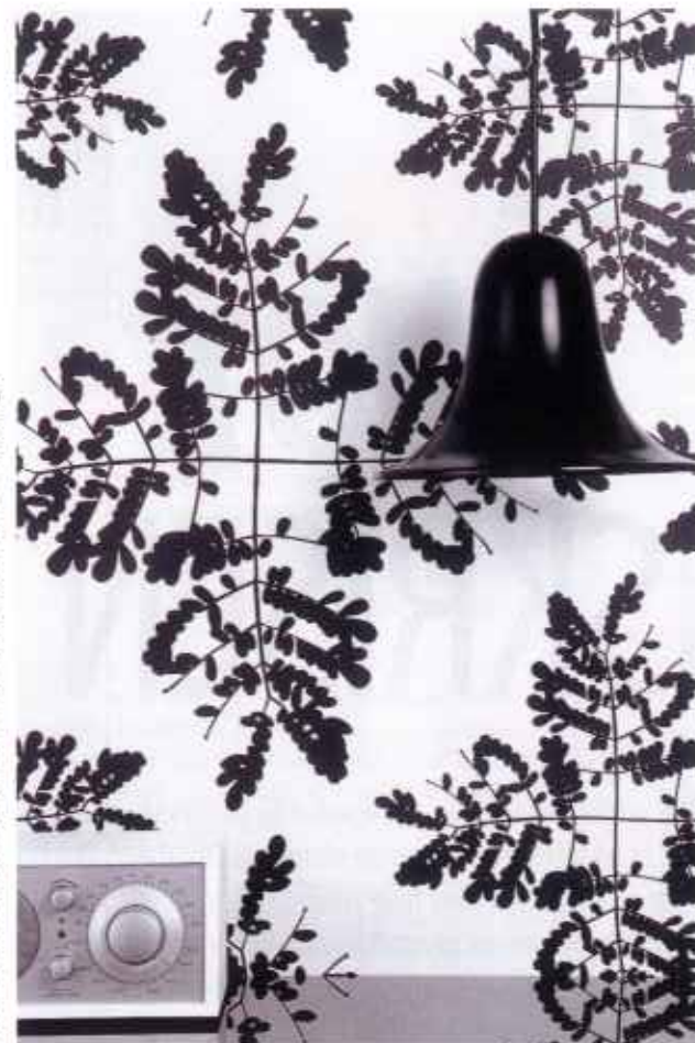
TAPET , Little Leaves, 53 cm x 10 m, 450 kr. Fra Ferm Living.