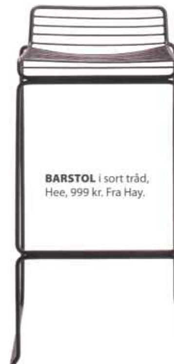
BARSTOL i sort tråd, Hee, 999 kr. Fra Hay.