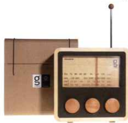
Sjov retroradio lavet af indonesisk genbrugstræ. Kan tilsluttes ipod og supplerende højttalere. Radioen er fra amerikanske Areaware. 1.450 kr., Hill Street.