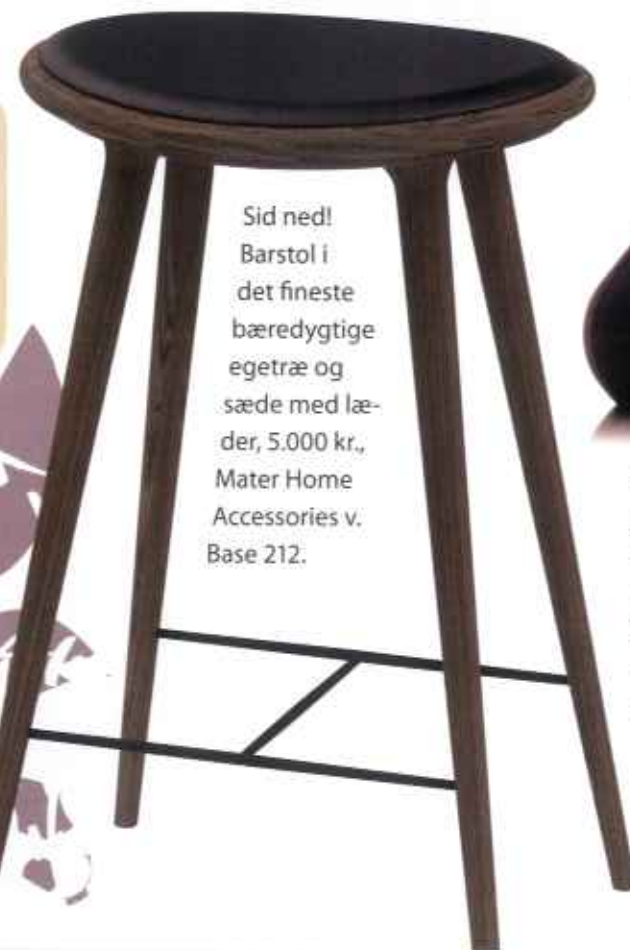
Sid ned! Barstol i det fineste bæredygtige egetræ og sæde med læder, 5.000 kr., Mater Home Accessories v. Base 212.