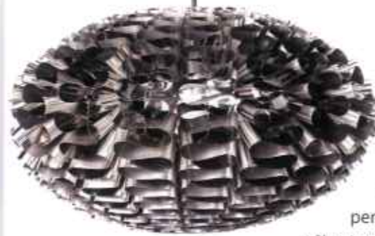
Masser af power! Norm 03-pendel i rustfri stål, 4.500 kr., Normann Copenhagen.