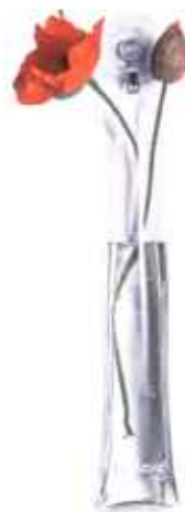
Pift op med en blomst. Lille plastikvase med sugekop, Suck Flower Holder, 50 kr., Hil Street.