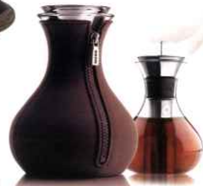
Eva Solos fine tebrygger i glas, der kan brygge både almindelig te og langtids-trækkende te som f.eks. grøn te og urtete, fås nu med overtræk i en varm chokoladebrun, 449 kr.