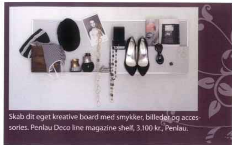
Skab dit eget kreative board med smykker, billeder og accessories. Penlau Deco line magazine shelf, 3.100 kr., Penlau.