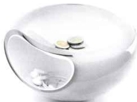
Gem rodet væk. Ganske elegant. Smiley-skålen er egentligt tiltænkt snacks, men er lige så god til f.eks. nøgler, gear og småpenge. 499 kr., Eva Solo.